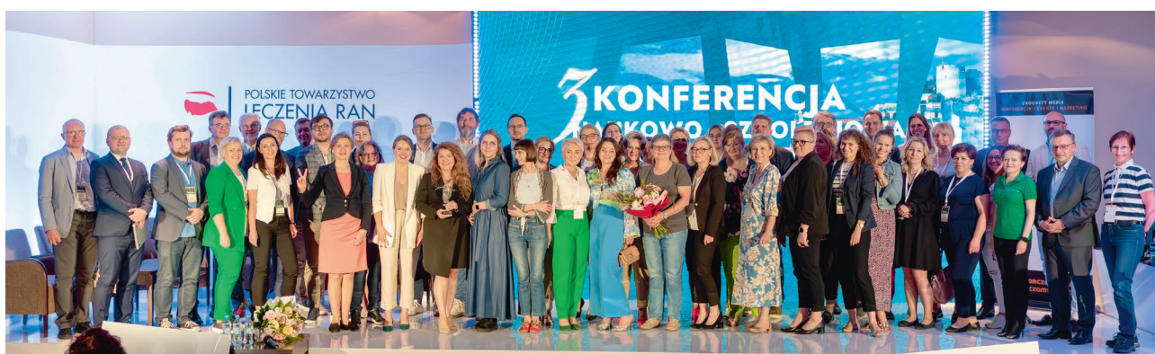
Rycina 4. Fotografia upamiętniająca uroczyste zakończenie konferencji